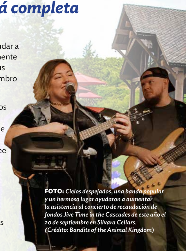
FOTO: Cielos despejados, una banda popular y un hermoso lugar ayudaron a aumentar la asistencia al concierto de recaudación de fondos Jive Time in the Cascades de este año el 20 de septiembre en Silvara Cellars.

Esto marca el segundo proyecto exitoso del CMF en el 2025. En el Marson y Marson Cascade Golf Clásico en Junio, la Fundación completó la recaudación de fondos para el "Paquete Clínico".